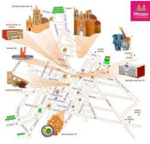
Cerro de los magueyes