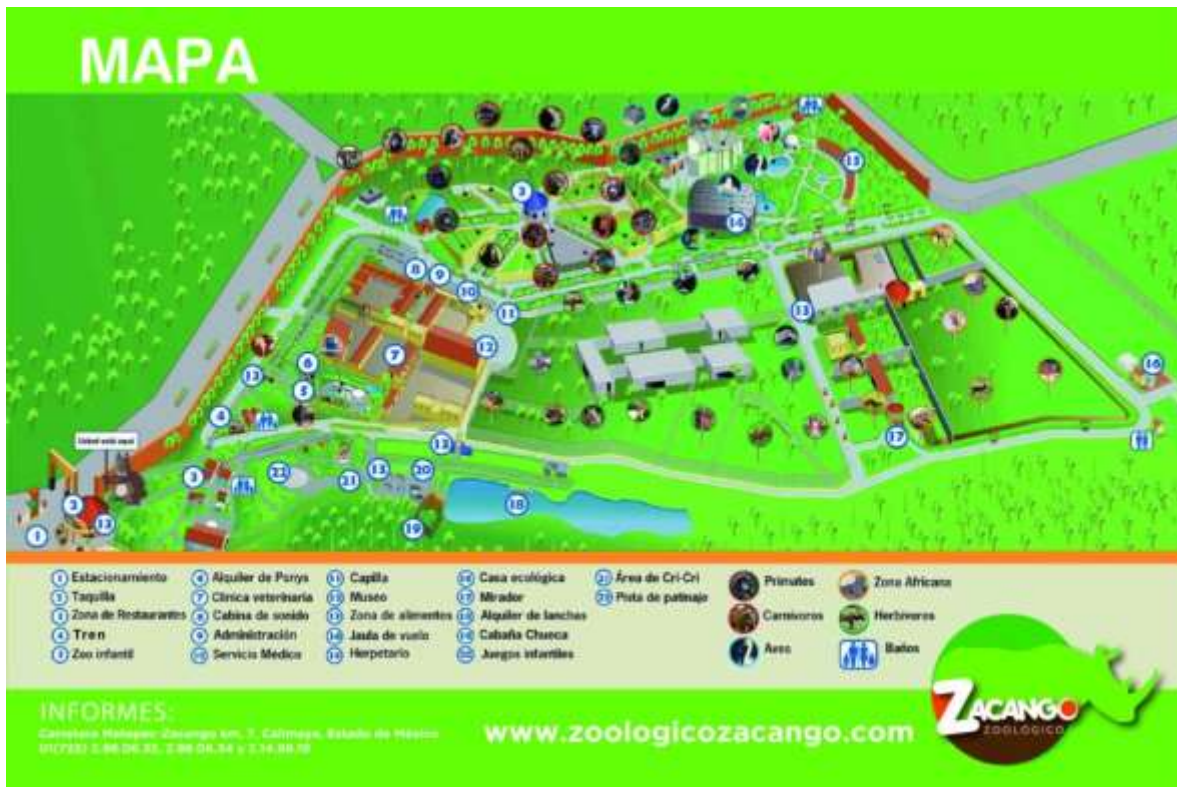
Zoológico de Zacango