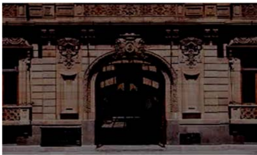
Museo de la máscara