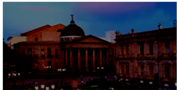
Teatro de la Paz