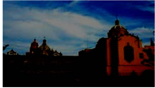
Plaza de Arazazu, Museo regional, Callejon de San Francisco