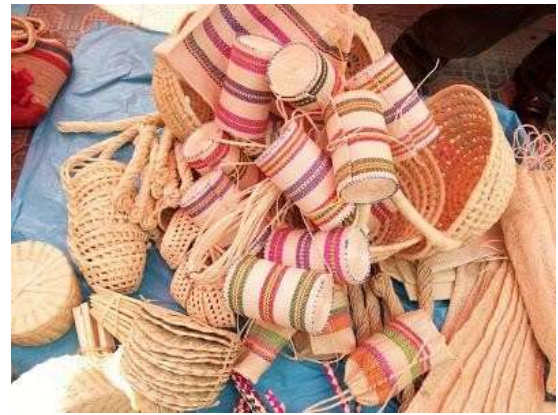
Artesanías de la Región.