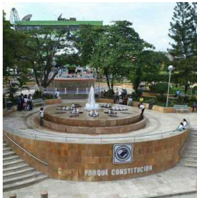
Parque Constitución Zona Centro