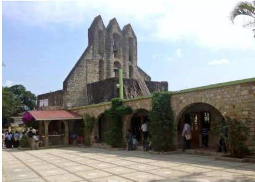
Iglesia Santiago Apóstol